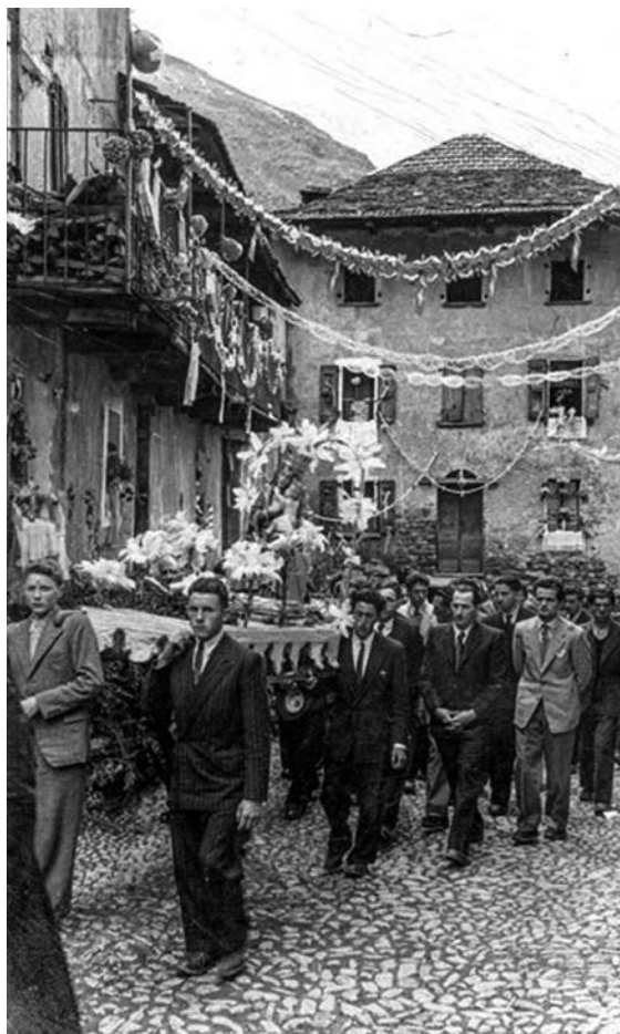
Momento solenne e festoso a Isonne per una delle prime uscite della Madonna Pellegrina. La fotografia è stata scattata nel 1949 nel nucleo storico del villaggio.