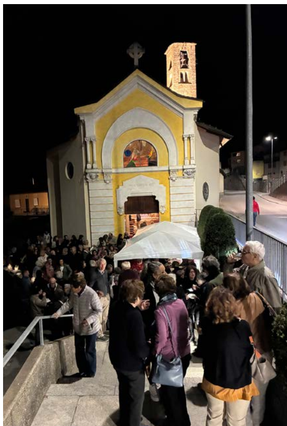
La prova generale ha richiamato il pubblico delle grandi occasioni. La storia è ancora viva nella comunità della valle.